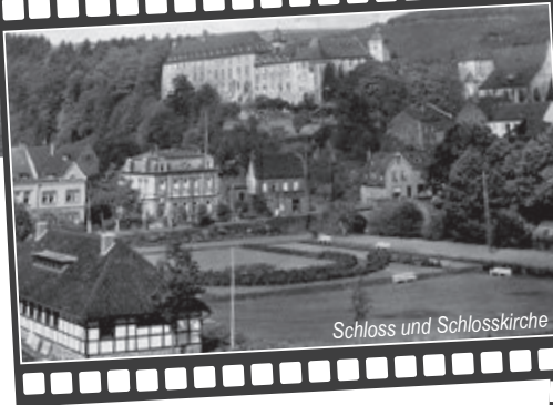
Schloss und Schlosskirche